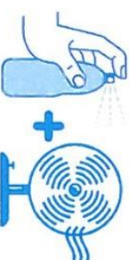
Je mouille mon corps et je me ventile