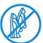
J'évite les efforts physiques