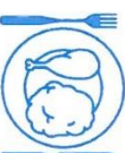
Je mange en quantité suffisante