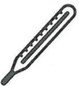
Fièvre > 38°C