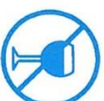
Je ne bois pas d'alcool